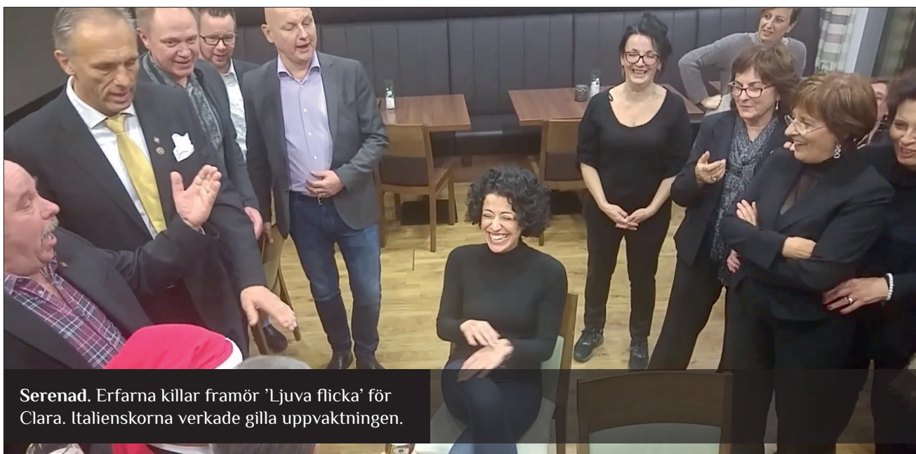
Serenad. Erfarna killar framför 'Ljuva flicka' för Clara. Italienskorna verkade gilla uppvaktningen.