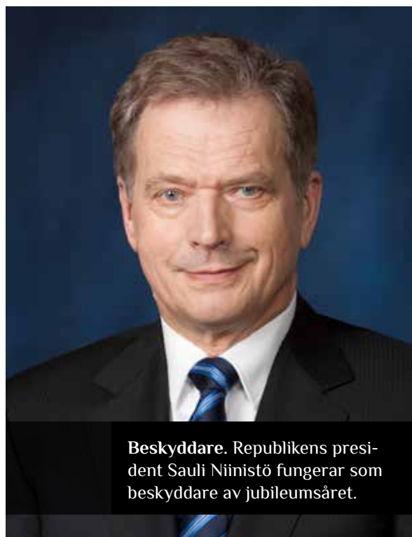
Beskyddare. Republikens president Sauli Niinistö fungerar som beskyddare av jubileumsåret.