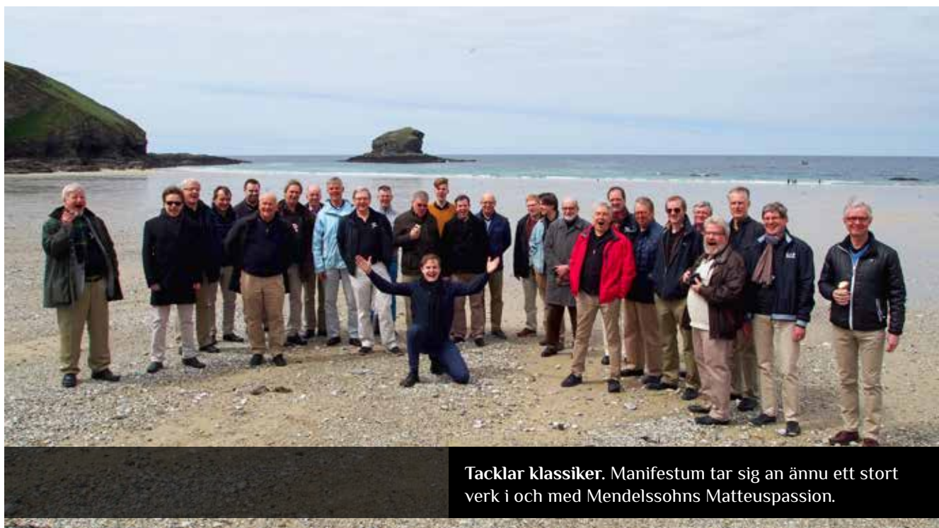
Tacklar klassiker. Manifestum tar sig an ännu ett stort verk i och med Mendelssohns Matteuspassion.