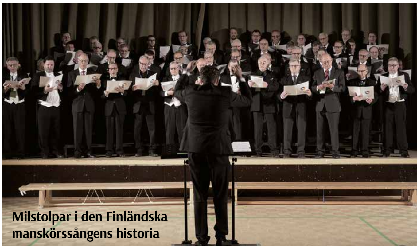
Milstolpar i den Finländska manskörssångens historia