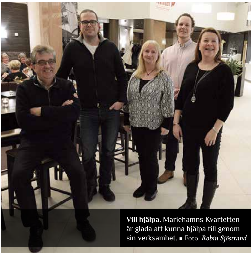
Vill hjälpa. Mariehamns Kvartetten är glada att kunna hjälpa till genom sin verksamhet.